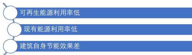
图1 建筑墙体节能保温施工现存问题

虽然近年来我国节能环保领域发展态势总体良好,但建筑墙体节能保温施工环节仍存在诸多问题,如图1所示。